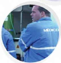
Proteção nos momentos mais difíceis