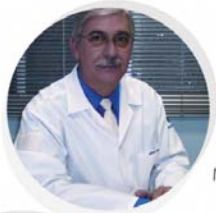
Médicos de plantão 24h