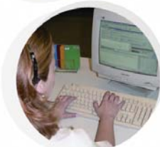
Esclareça suas dúvidas médicas cotidianas