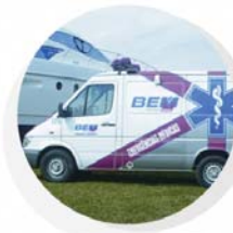
Agilidade e segurança no atendimento